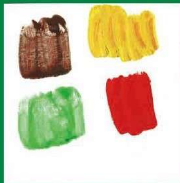
保田粒人《びーまん》